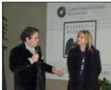
Vittorio Sgarbi e Philippe Daverio in visita ai Musei di Montichiari